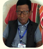
जंगवीर आले मगर वडाध्यक्ष वडा नं. ७