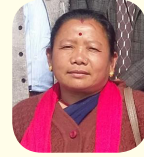
भविसरा आले वडाध्यक्ष वडा नं. ८