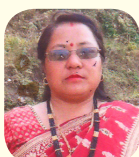
यमुना श्रेष्ठ सदस्य